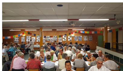
... a fait recette