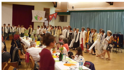
pour toutes et tous