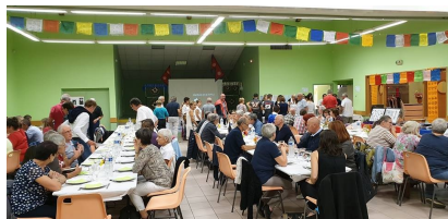
La soirée de Balanod organisée par Gym passion ...