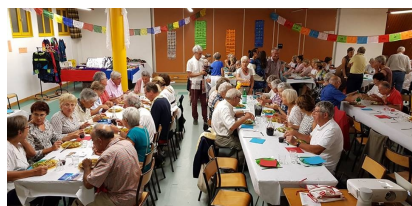
La soirée de Cran Gevrier organisée par le Club Hervé...