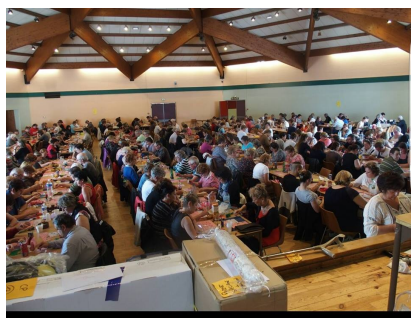
Beaucoup de monde