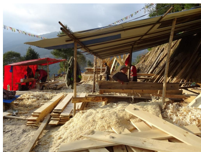
Les menuisiers à l'oeuvre