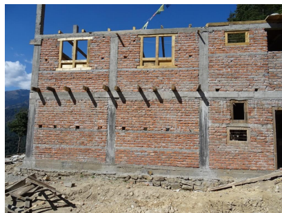
La façade Est du bâtiment

Les travaux se poursuivent pour mettre le bâtiment hors d'eau.