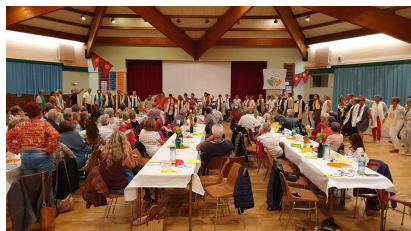
A Montmorot, la danse népalaise est à l'honneur