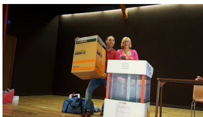
... et de gros lots