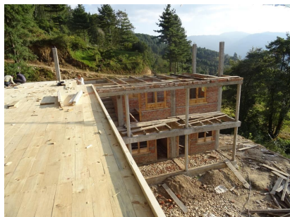
Le plancher du grenier